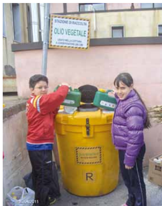
La stazione di raccolta di olio vegetale nell'istituto Denza

Il rispetto per l'ambiente comincia tra le mura di casa e dal modo di comportarsi di ogni essere umano. Sapevate che anche l'olio usato può essere riciclato? Ogni volta che si scarica l'olio avanzato dalla frittura in un lavandino o nel water, oppure si cambia l'olio al motore spargendo quello usato sul terreno si provocano dei danni seri all'ambiente. In particolare, se l'olio del motore è versato sul terreno contamina la vegetazione e gli organismi presenti nel suolo, mentre quello alimentare usato impedisce alle piante di assorbire le sostanze nutritive. Per quanto riguarda l'acqua, entrambi si espandono in superficie e impediscono il passaggio di ossigeno, danneggiando flora e fauna. L'olio alimentare che arriva alla falda acquifera rende l'acqua non potabile. Anche l'aria ne risente in modo particolare: bruciare l'olio