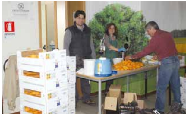
Una giornata speciale al Denza con la spremuta di arance