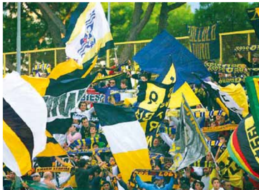
I tifosi della Juve Stabia sostengono la loro squadra