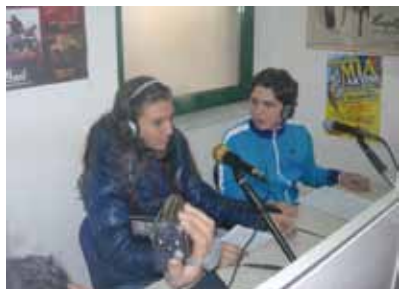
All'Iti per il nostro "Radio racconto" sull'istituto comprensivo "Luigi Denza"

Tre minuti di "radio racconto" per gli alunni del Denza, speaker per un giorno